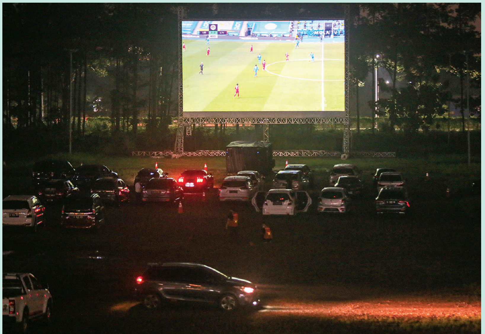
NOBAR SEPAK BOLA SECARA DRIVE-IN: Sejumlah mobil mendatangi area pemutaran pertandingan sepak bola di area parkir Mal Alam Sutera, Kota Tangerang, Banten, Sabtu (13/2). Suporter pendukung klub-klub yang berlaga di Piala Menpora 2021 dapat mengadopsinya untuk memberi dukungan pada tim pujaan karena ajang sepak bola pramusim yang bergulir mulai 21 Maret mendatang melarang penonton hadir di stadion serta larangan berkerumun.

Disampaikannya, bahwa Bonek Mania berkomitmen untuk tidak datang ke stadion selama gelaran Piala Menpora 2021. Suporter yang identik dengan warna hijau tersebut mengatakan keputusan itu diambilnya setelah mempertimbangkan aspek keamanan dan kesehatan menyusul pandemi covid-19 yang belum terkendali di Indonesia. "Komitmen kita soal kemanusiaan tidak main-main, kalau memang peraturannya seperti itu ya kita siap," tegasnya.