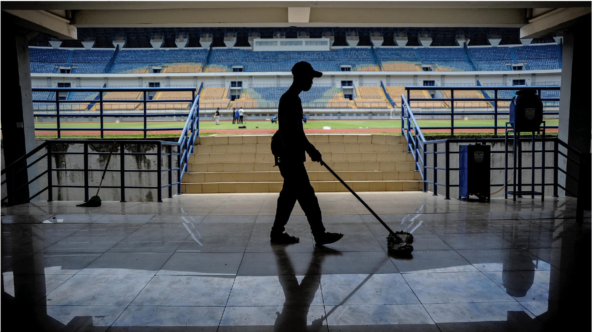
GELAR PIALA MENPORA 2021: Petugas kebersihan membersihkan tribunet Stadion Gelora Bandung Lautan Api (GBLA) di Bandung, Jawa Barat, Senin (1/3). Stadion GBLA diproyeksikan menjadi tempat berlangsungnya ajang turnamen Piala Menpora 2021 yang rencananya digelar mulai 21 Maret mendatang.